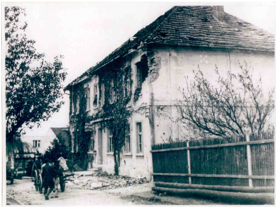
Budova obecního úřadu po válečných událostech z dubna roku 1945